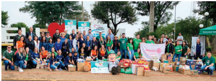
Dia de Cooperar reuniu associados das cooperativas em diversos pontos e arrecadou doações para os lares de idosos de Três de Maio

XVI FESTIVAL CANCIONEIRO - O Festival da Canção Gaúcha e Nativista acontece nos dias 1º e 2 de setembro e é promovido pelo CTG Querência Alegre, de Alegria. As inscrições são gratuitas até o dia 21 de julho. O evento conta com as categorias adulto, livre, local, categoria Apae e música mais popular. São mais de R$ 8 mil em prêmios. No dia 1º de setembro, a animação será de Chiquito e Bordoneio, e no dia 2, de Cristiano Quevedo. Informações pelo telefone (55) 9 9944-8242.