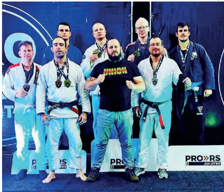
Atletas três-maienses que participaram da competição no último domingo

No último domingo, dia 2, ocorreu a primeira etapa do Campeonato PRO RS de Jiu-Jitsu, em Santo Ângelo. Pela primeira vez, o evento foi realizado em uma cidade da região e contou com mais de 200 atletas, mostrando a vitalidade e a paixão que o esporte tem no interior do Estado.