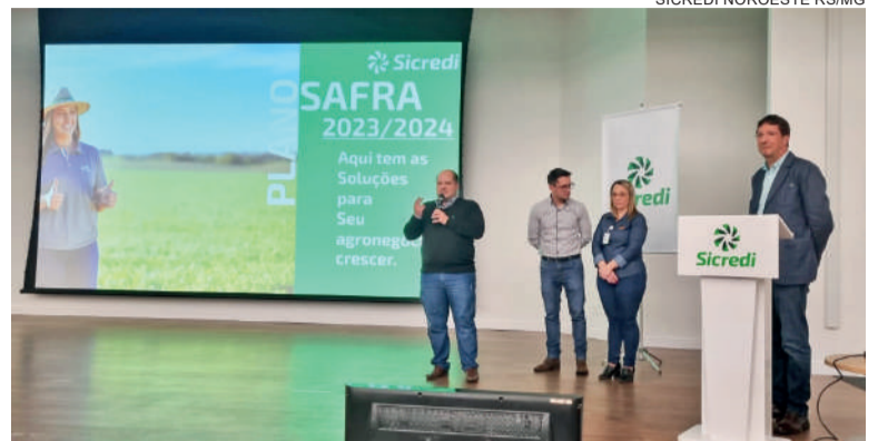
Plano Safra 2023/2024 foi lançado na segunda-feira

Quanto aos juros, Glei reforçou que as taxas ficaram próximas ao plano anterior. “Basicamente, as taxas de juros se mantiveram