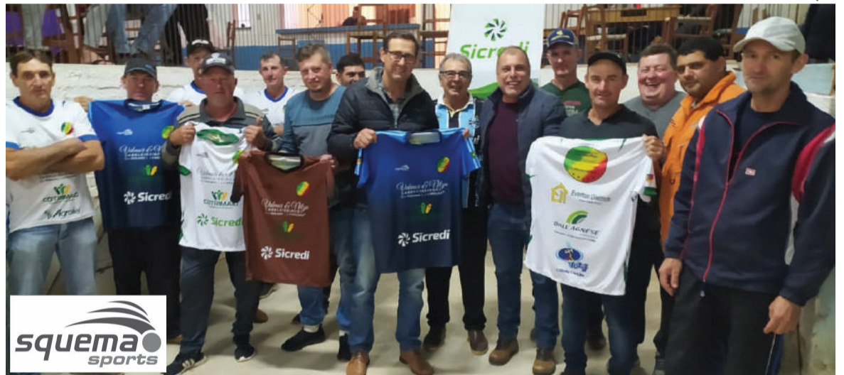
Noite foi de entrega das camisetas da edição 2023 do Campeonato de Bochas Sicredi/Valmor e Nilza Cabeleireiros

Na sexta-feira, dia 30 de junho, na comunidade de Manchinha, ocorreu mais uma partida pelo Campeonato de Bochas Sicredi/Valmor e Nilza Cabeleireiros. O resultado foi São Luiz de Manchinha 4X0 Santo Antônio.