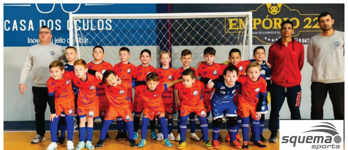
Equipe sub-9 da Crednor Futsal. Primeira rodada foi de vitória por 10 a 1 na Liga Sicredi de Futsal