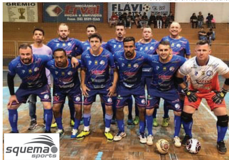
No Veterano, Crednor foi campeão