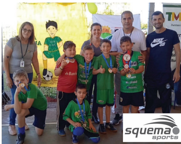
Equipe de Bem Viver Caúna, campeã na categoria sub-9