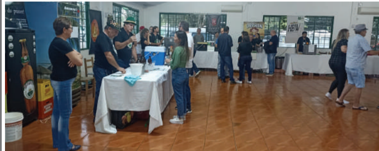
Festival da Cerveja Artesanal reuniu cervejeiros da região na sede do Oriental

TRÂNSITO INTERROMPIDO I - Das 8 às 18h, na Avenida Uruguai, trecho entre a rótula da Igreja Matriz Católica e a Rótula Willy Beckert, na terça-feira, dia 30. O motivo é a retirada de cabos e fiação da rede de internet e telefonia fixa sem uso que se acumulam ao longo da via pelas empresas que prestam esse serviço no município.