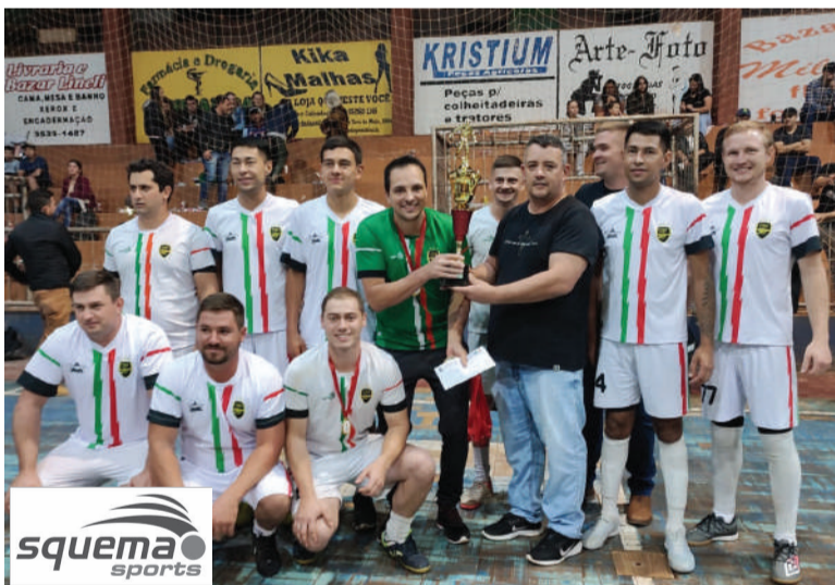
Pela categoria Interiorano, São Valentim ficou com o título

A competição, que começou no início do mês de abril, reuniu 33 equipes de sete municípios da região. Confira os campeões.