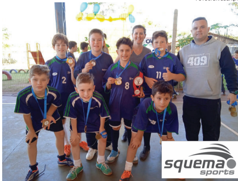
Equipe da Setrem, campeã na categoria sub-11

Chegaram nas finais na categoria sub-9 Bem Viver Caúna , que venceu por 3X0 a São Pedro . Já na sub-11 levou o título a Setrem , que venceu por 1X0 a escola Bem Viver Caúna .