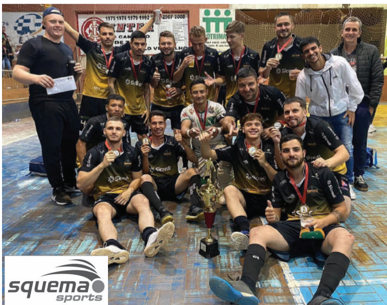
Maipi do Brasil ficou com o título pela Categoria Livre