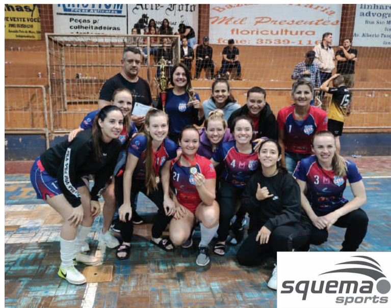
Santa Rosa foi campeã na Categoria Feminino