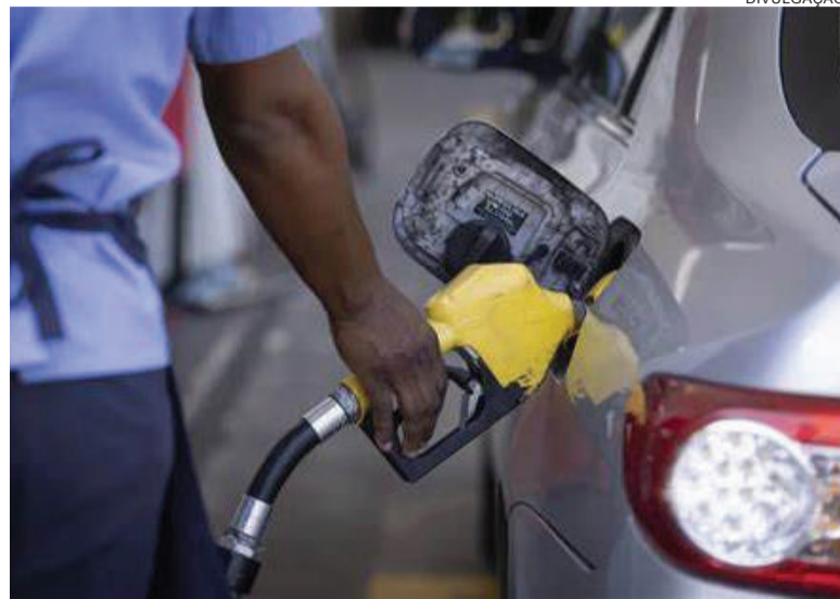
Preço médio da gasolina recuou em R$ 0,39 em maio

Diesel teve maior redução: quase 9%. Gasolina caiu, em média, 6%