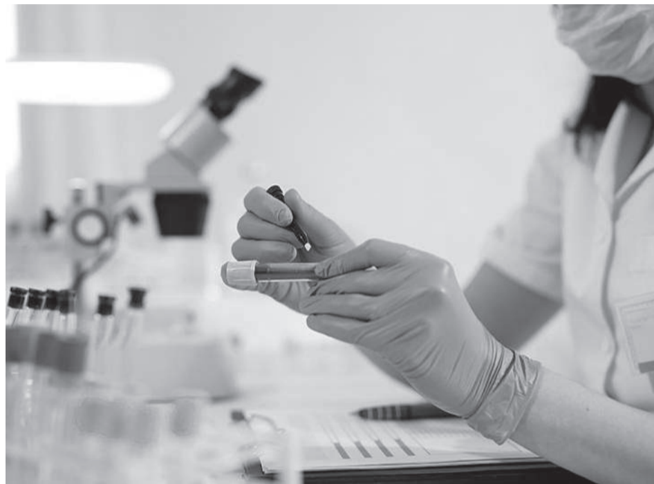
Os resultados dos testes executados em farmácias e consultórios não devem ser usados para a tomada final de decisões clínicas, mas, sim, como objeto de triagem

A Anvisa determina que as farmácias, consultórios médicos (geograficamente isolados) e drogarias estão habilitados a