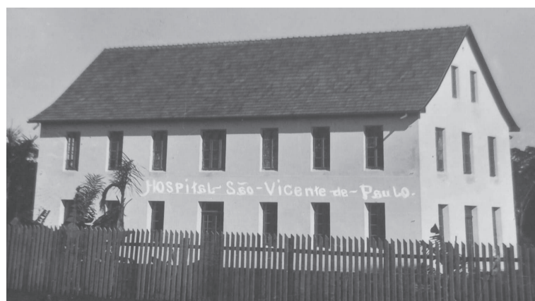
Primeiro prédio do Hospital São Vicente de Paulo no ano de 1936

Que bom que ainda podemos contar com o nosso Hospital São Vicente de Paulo!