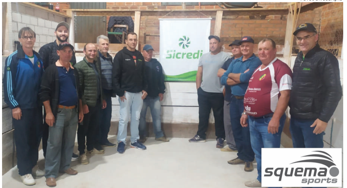
Equipe de Esquina Bado