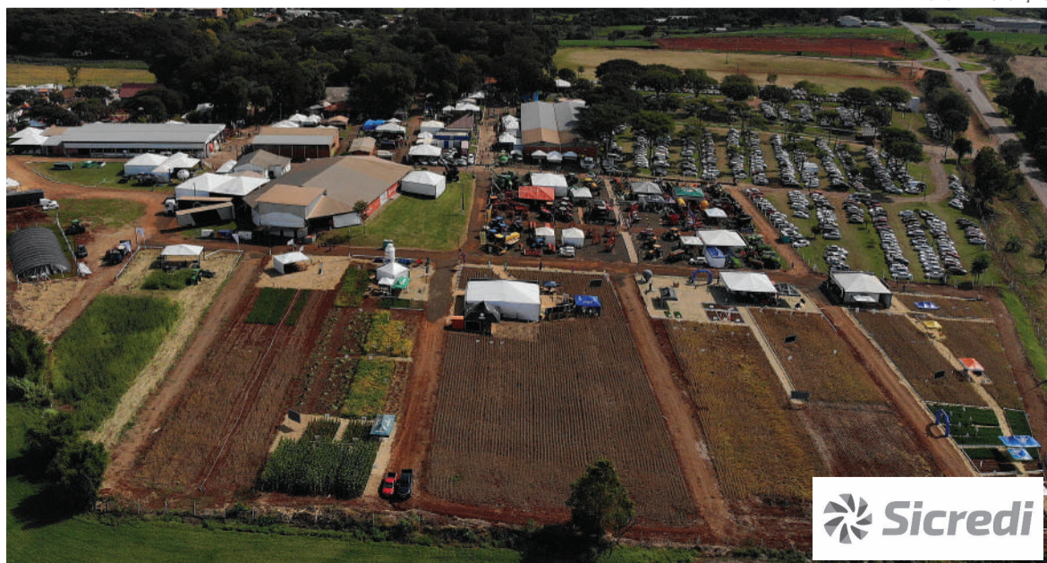
No espaço Agro, uma parceria entre a Setrem, Emater e as empresas Agrosol, Mais Agronegócios, Rural Mais e Tarumã foi realizado o Dia de Campo do Agronegócio, que apresentou cultivares e tecnologias que podem ser alternativas aos produtores rurais da região

As empresas estão apresentando todos os resultados das pesquisas e as novidades em produtos até o domingo, último dia da feira.