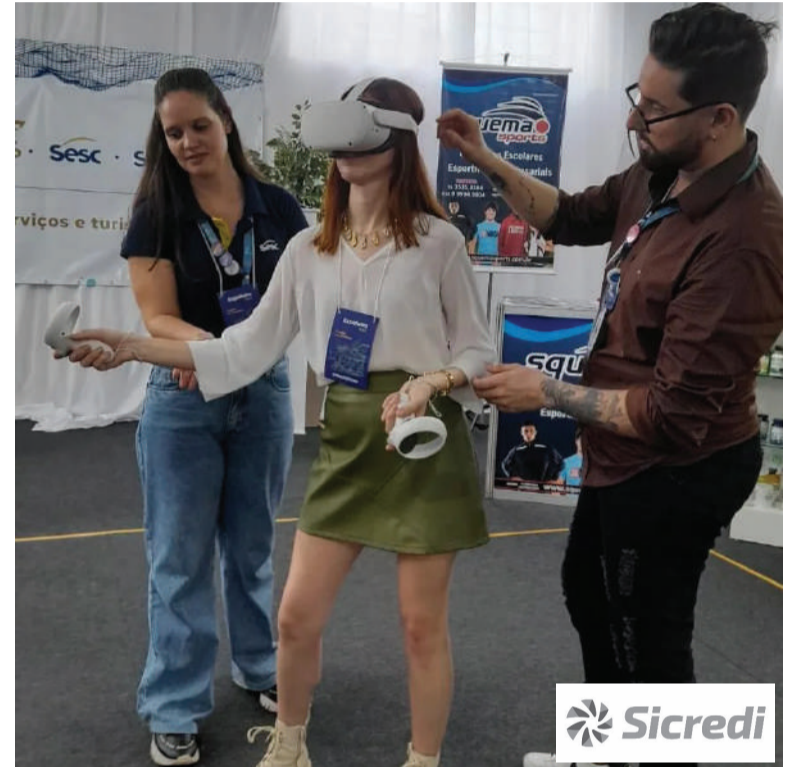
Visitantes podem conferir o 'Oculus Quest 2 Meta Verso', no Pavilhão da Amostra Multisetorial da ACI e Sindilojas

No pavilhão os visitantes podem encontrar amostras das empresas Jardinox, Móveis Canção, Mais Natural, Squema, Sesc, Senac, Hettwer, Reiflex e Mar-río.