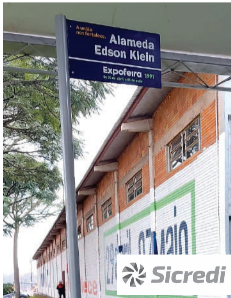
Placas com os nomes dos presidentes da feira foram instaladas no parque

Agora, as ruas do Parque de Exposições Germano Dockhorn estão identificadas com os nomes dos 16 presidentes que já passaram pela presidência da Expofeira, que iniciou em 1991, ainda no Clube Buricá.