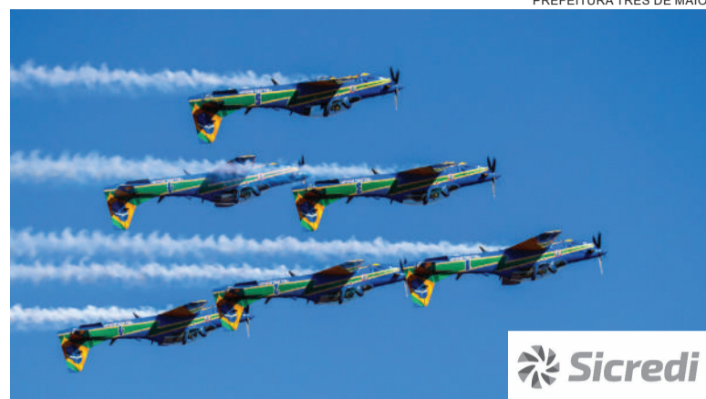
Apresentação contou com sete aeronaves da Força Aérea Brasileira e encantou o público presente no Parque de Exposições

A apresentação do Esquadrão de Demonstração Aérea (EDA), da Força Aérea Brasileira (FAB), carinhosamente conhecido por Esquadrilha da Fumaça , abrilhantou a tarde de domingo durante a Expofeira, com uma belíssima apresentação.