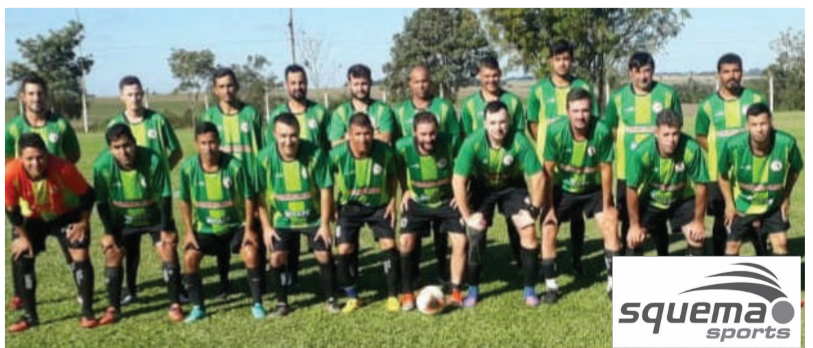
Veteranos: equipe do Guarany, de Consolata

O CAMPEONATO DE BOCHAS SICREDI/VALMOR E NILZA CABELEIREIROS , na modalidade de trio, promovido em nome da comunidade de Esquina Bado, na sexta-feira que passou ocorreu um jogo do complemento da 3ª rodada na comunidade de Barrinha: Dom Pedro de Barrinha 3 X 1 Santo Antônio. Hoje à noite, na comunidade de Barrinha: Dom Pedro de Barrinha X Esquina Bado e na sequência, em Santo Antônio, jogam Santo Antônio X Manchinha.