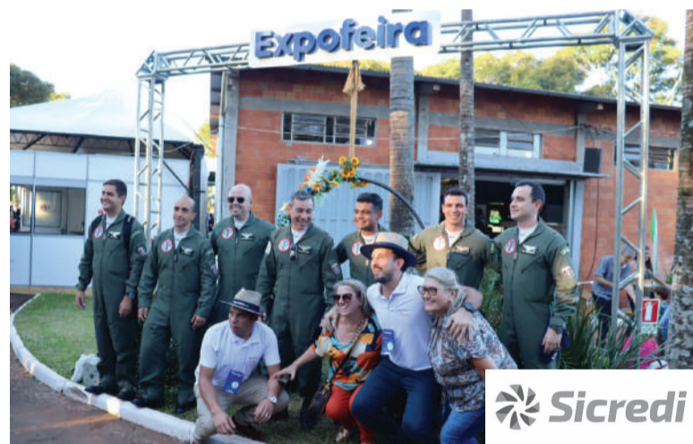
Pilotos da EDA visitaram a feira após a apresentação

Manobras como parafuso, loopings e o lindo coração que encerrou a apresentação encantaram as milhares de pessoas que se aglomeraram no estacionamento do parque e nas ruas próximas.