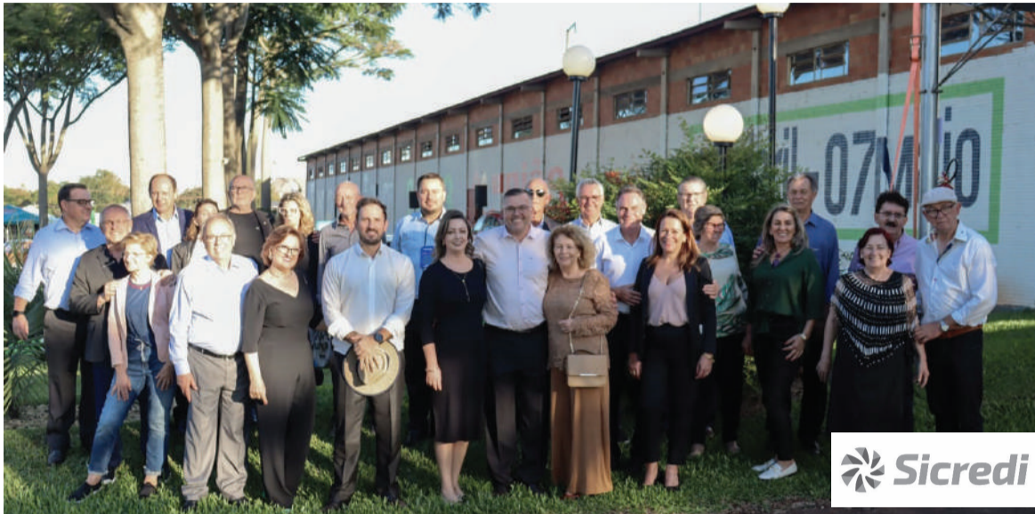
16 ex-presidentes da feira receberam homenagem na Expofeira 2023. A maioria dos ex-presidentes ou familiares esteve presente na solenidade