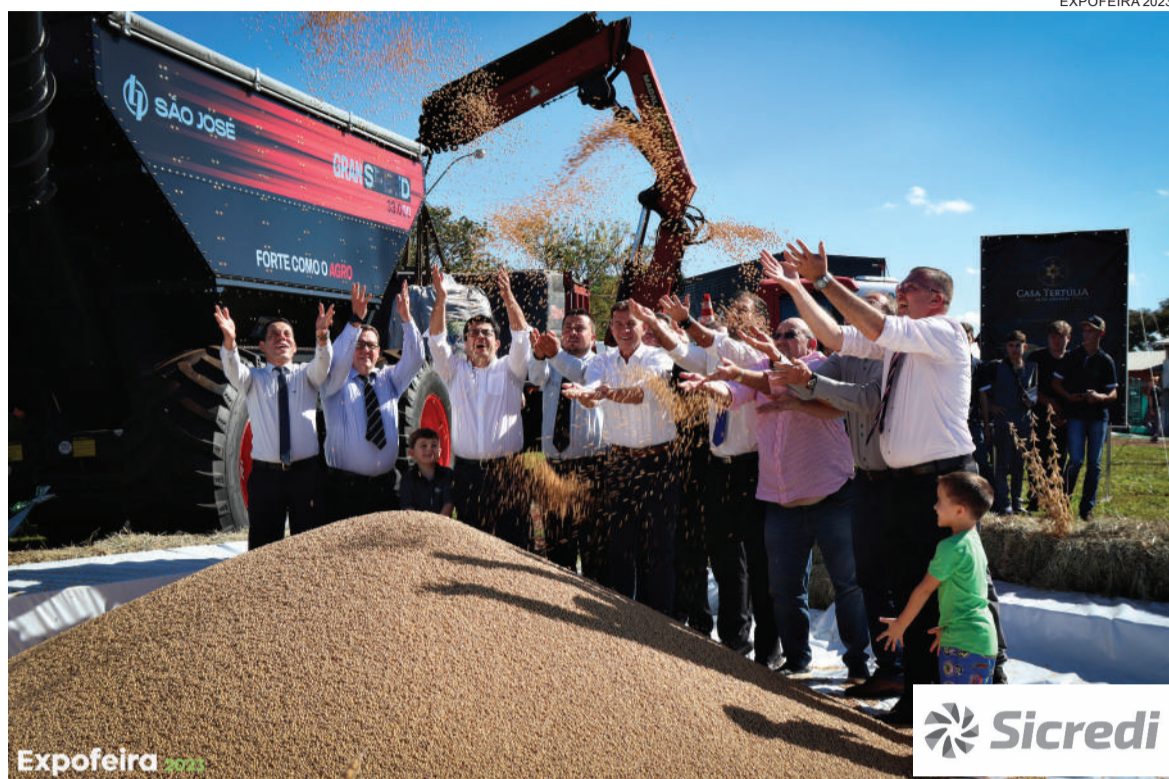
Ato simbólico marcou o Encerramento Oficial da Colheita da Soja, no ensolarado 29 de abril

Após a abertura oficial da feira ocorreu ato simbólico do Encerramento Nacional da Colheita da Soja . O evento foi uma parceria entre a feira três-maiense e a Feira Nacional da Soja - Fenasoja, de Santa Rosa, berço da oleaginosa.