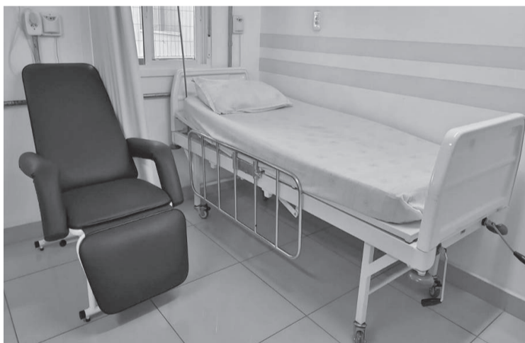
Foram adquiridas seis poltronas reclináveis (como a da foto) para acompanhantes