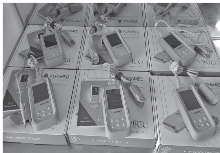
Seis oxímetros portáteis (saturação, frequência cardíaca e respiratória)