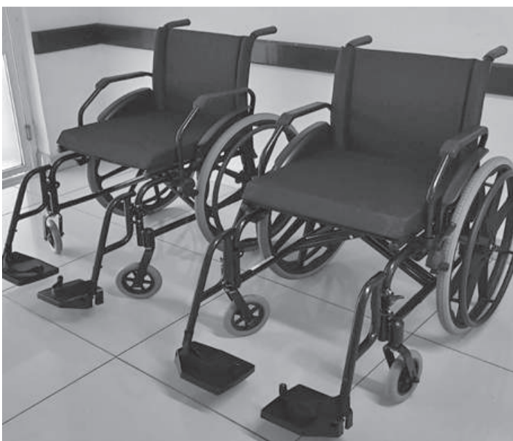
Dois cadeiras de rodas, dobráveis, até 130 kg