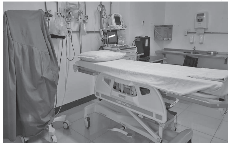
Dois macas com suporte de soro e oxigênio com trendelemburg