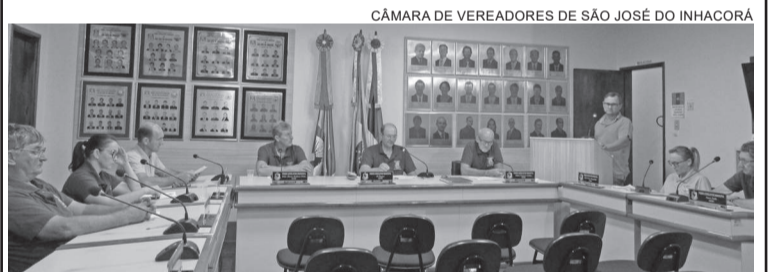
A 6ª Sessão Ordinária do ano foi realizada na noite de segunda-feira, dia 24 de abril

A próxima sessão ordinária está prevista para o dia 8 de maio de 2023, às 19h, nas dependências da Câmara de Vereadores.