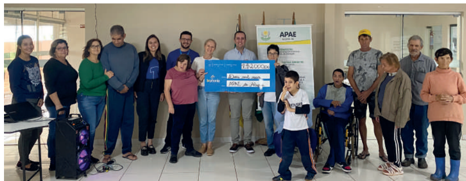
Brphonia irá fornecer internet de forma totalmente gratuita para a Apae de Alegria

A partir do mês maio a cidade de Alegria irá contar com a rede de internet da Brphonia. Esse é mais um avanço da empresa no âmbito regional. Para quem tem interesse, já é possível contratar os planos de internet e telefonia, basta entrar em contato pelo telefone 55 3513-0012.