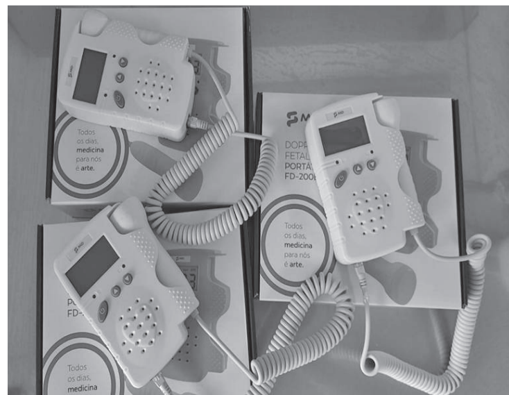
Três detectores cardiotetais para gestantes