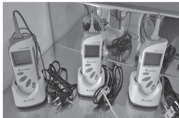
Três oxímetros com base/pilha recarregáveis