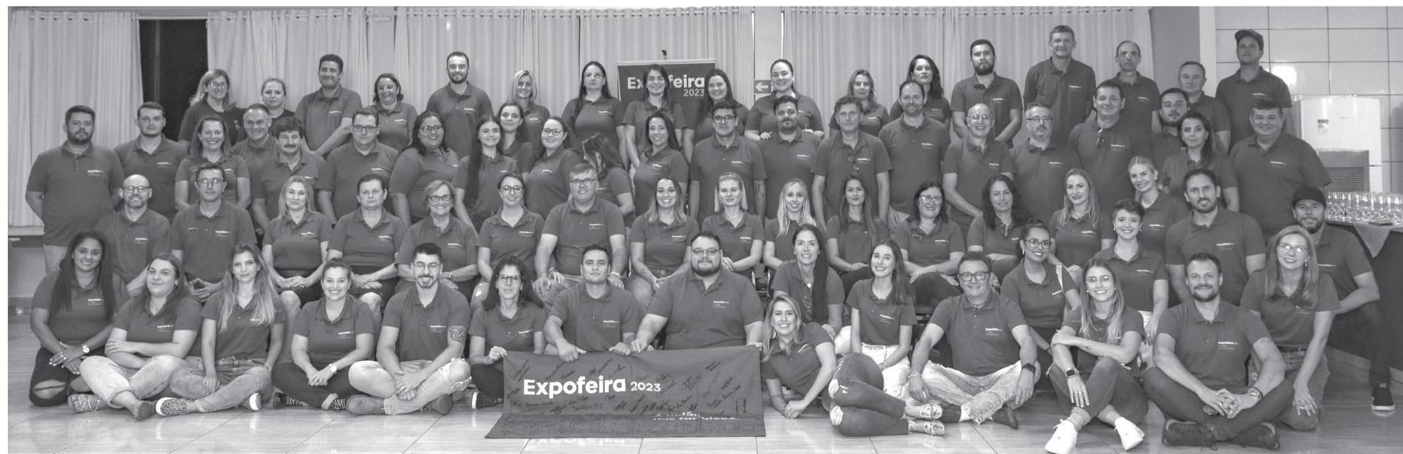
Equipe de voluntários da Expofeira 2023 conta com mais de 100 pessoas