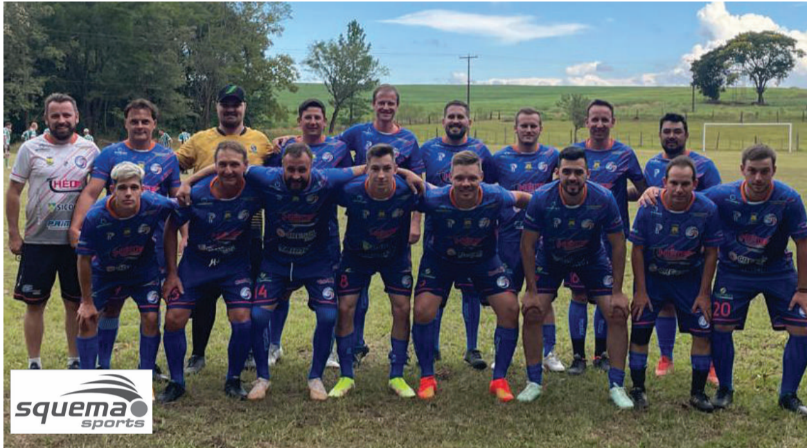
Comunidade de Rocinha retornou aos campos no último final de semana com a equipe Rocinha/Crednor