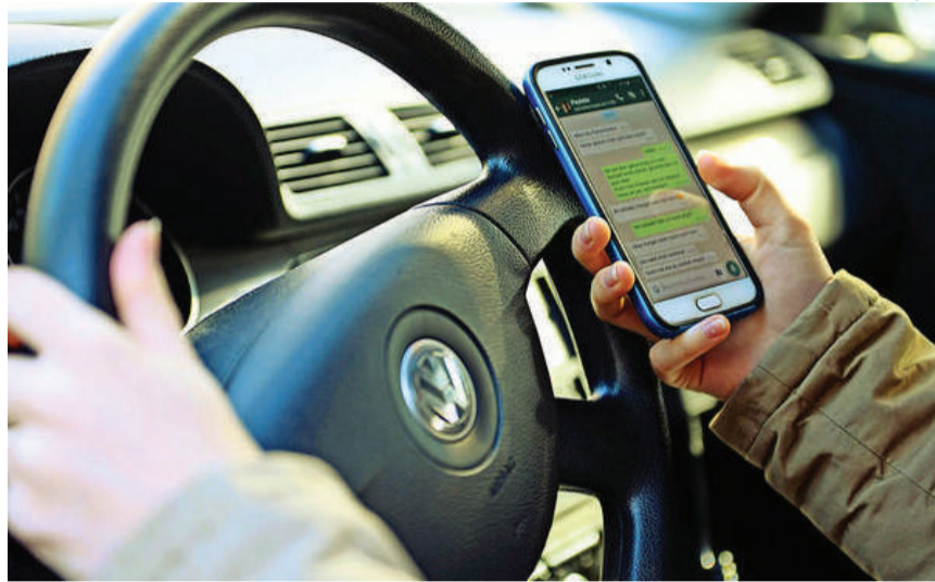
Empresas que oferecem transporte remunerado privado individual de passageiros por meio de aplicativos e outras plataformas tecnológicas devem se adequar à legislação municipal

O tenente acrescenta que o veículo que estiver transportando o passageiro de forma irregular estará infringindo o artigo 231, VIII do Código de Trânsito Brasileiro, que diz: transitar com o veículo efetuando transporte remunerado de pessoas ou bens, quando não for licenciado para esse fim, salvo casos de força maior ou com permissão da autoridade competente. “Os veículos que forem abordados e não estiverem regulares serão autuados neste artigo. Além de outras situações relativas à documentação do motorista e do veículo, que também precisam estar regulares”, conclui.