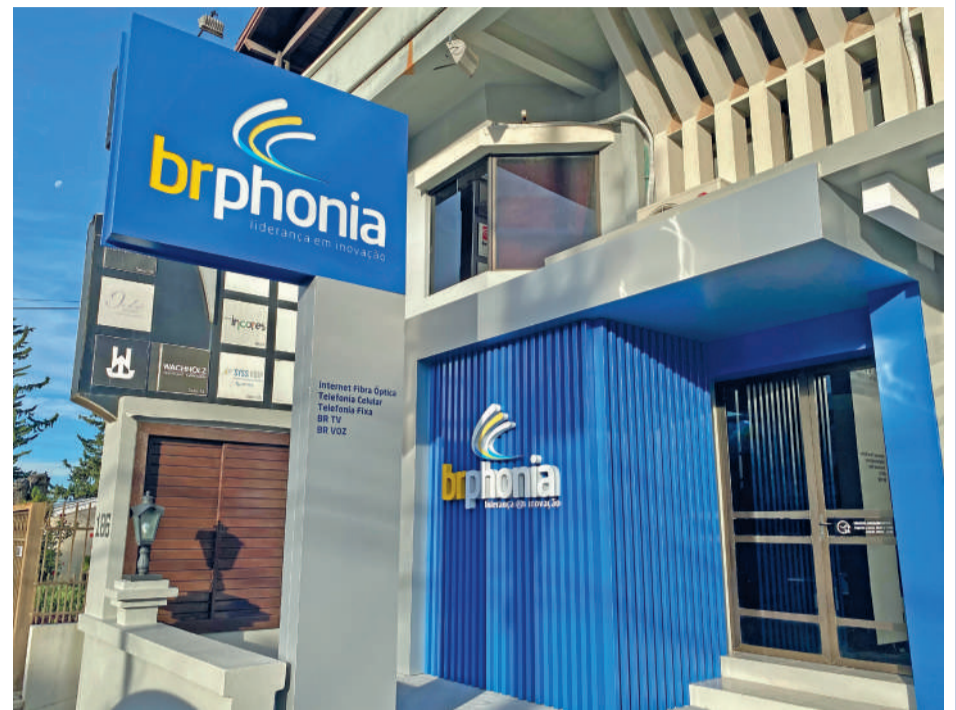
A loja está localizada na Rua Santa Rosa, 186 - Galeria Pohl