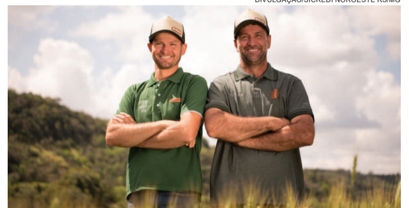
Projetos já podem ser encaminhados nas agências do Sicredi

São mais de R$ 200 milhões disponibilizados aos associados pela cooperativa