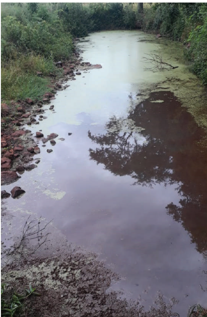
Devido às baixas precipitações nos últimos meses, açude reduziu volume e comprometeu a irrigação das verduras e legumes

No acumulado de chuvas do ano são 176 milímetros registrados, conforme levantamento da Comanja Comercial Agrícola, na área central de Três de Maio. Janeiro registrou 87 milímetros de precipitação e fevereiro, 89 mm.