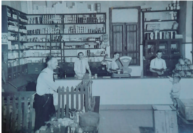
Registro do interior da Casa Germano Dockhorn