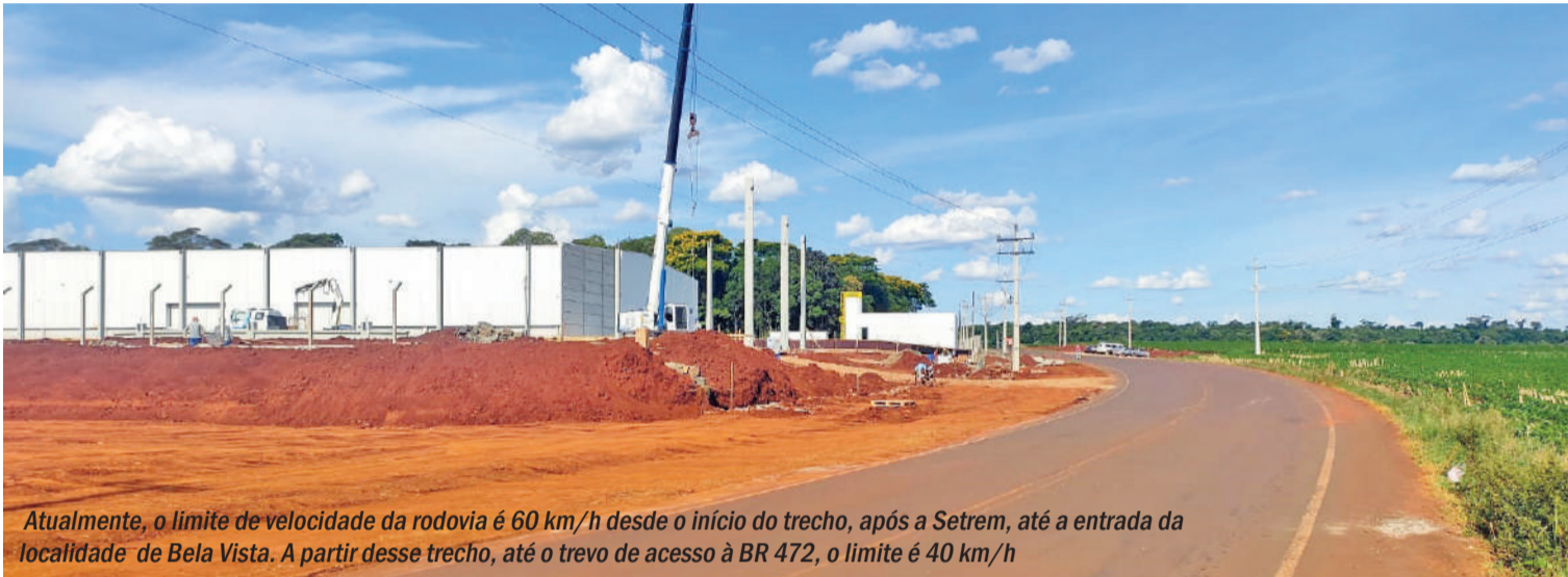
Atualmente, o limite de velocidade da rodovia é 60 km/h desde o início do trecho, após a Setrem, até a entrada da localidade de Bela Vista. A partir desse trecho, até o trevo de acesso à BR 472, o limite é 40 km/h