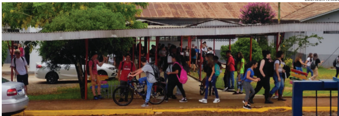
Atualmente, Três de Maio conta com duas escolas de educação básica na rede estadual - a Escola Castelo Branco e o Instituto Cardeal Pacelli

Conforme a 17ª Coordenadoria Regional de Educação, que abrange 22 municípios, sendo os 20 da Amufron, mais Giruá e São Paulo das Missões, são 12.784 estudantes da região que iniciaram o ano letivo de 2023 nas escolas da Rede Estadual de Ensino.