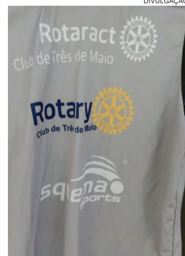
12 jalecos e uma bola de futebol foram doados para o projeto Futsocial Bairro Santa Rita, que oferece a prática de futsal para crianças e adolescentes

O objetivo do clube de serviços em realizar esta ação é fomentar o trabalho realizado dentro do bairro, onde as crianças são atendidas de forma voluntária, podendo praticar o esporte sob orientação, além de desfrutar dos valores desenvolvidos através da prática esportiva.