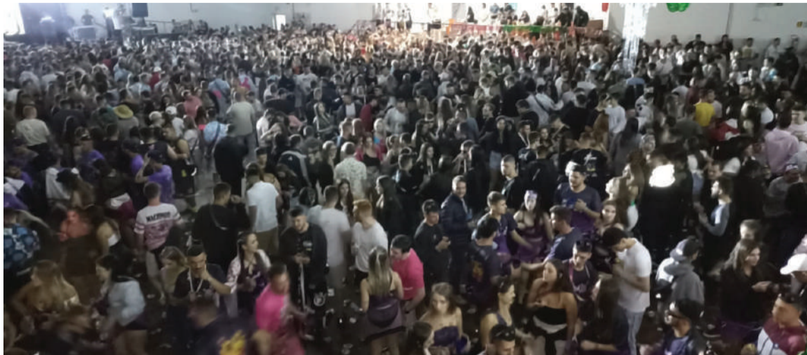
Ambiente interno teve Frões e Vibe Tri animando os foliões

Mais uma edição do Carnaval da Sociedade Recreativa e Cultural Buricá reuniu foliões de Três de Maio, Santa Rosa, Ijuí, Horizontina, Santo Augusto, Independência, Três Passos, entre outros municípios da região no último sábado, dia 18.