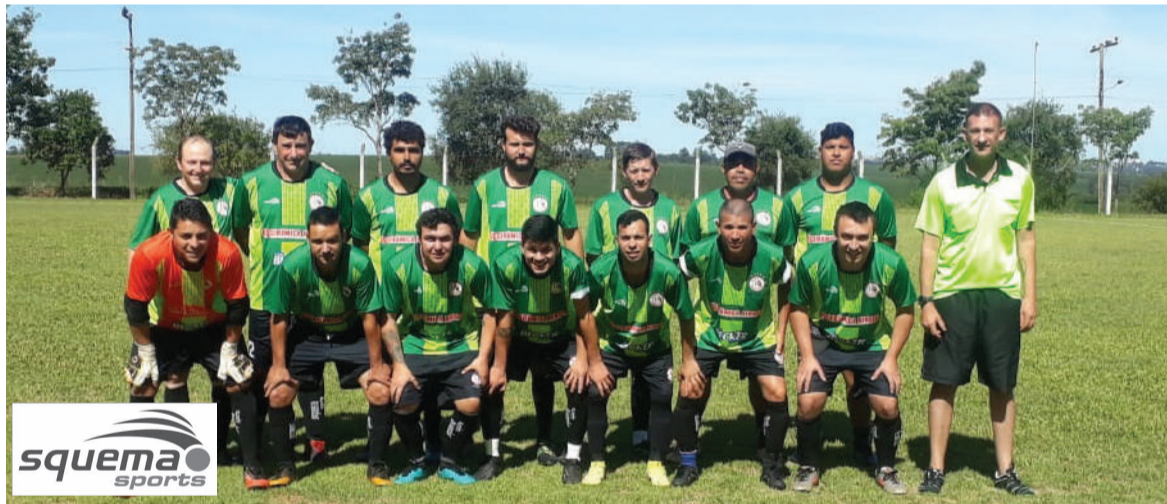
Equipe de veteranos do Guarani