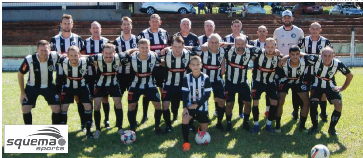
Equipe de veteranos do Botafogo

“O esporte nos desafia a superar as nossas próprias limitações.”