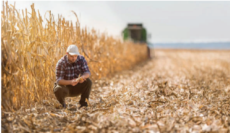
Do total do seguro agrícola nacional solicitados no ano passado, 19,1% eram do Rio Grande do Sul

Mesmo aumentando a procura pelo seguro, a proporção de área plantada e segurada é de 15% no Brasil. O índice é considerado baixo ao comparar com outros importantes produtores agrícolas, como os Estados Unidos, que contam com cerca de 90% da área segurada e a China, com algo em torno de 65%. O dado mostra que o ramo de seguros para a atividade agrícola tem muito campo para crescer no cenário nacional.