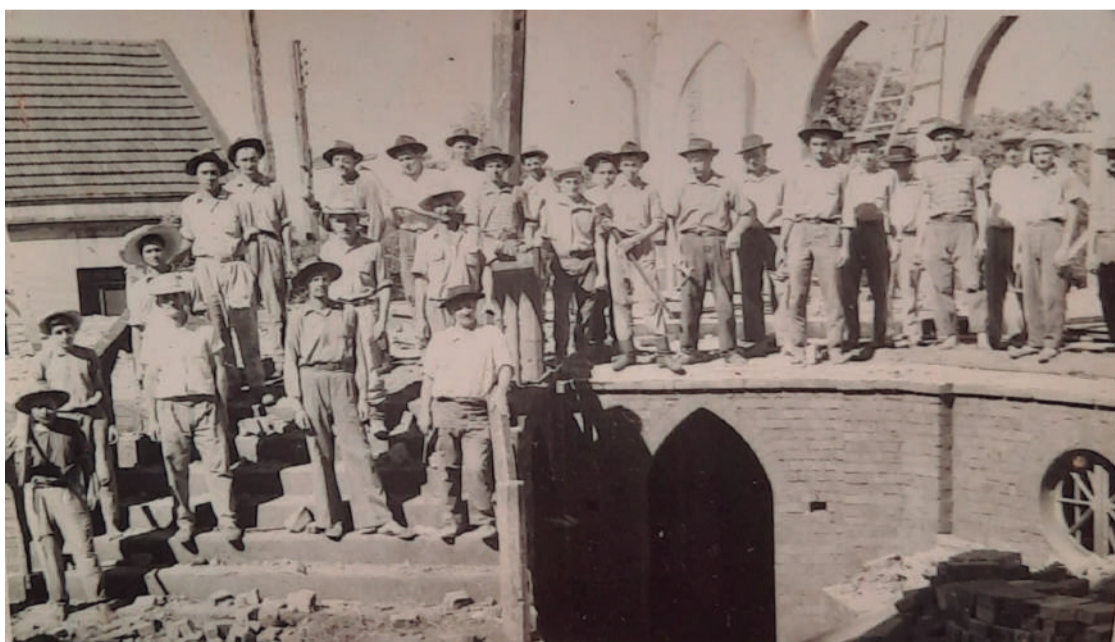
Registro do início da construção da Igreja Matriz Católica de Três de Maio no ano de 1934, sendo inaugurada oito anos depois

Em 1934, deu início aos projetos de construção da atual igreja matriz católica, em substituição à antiga