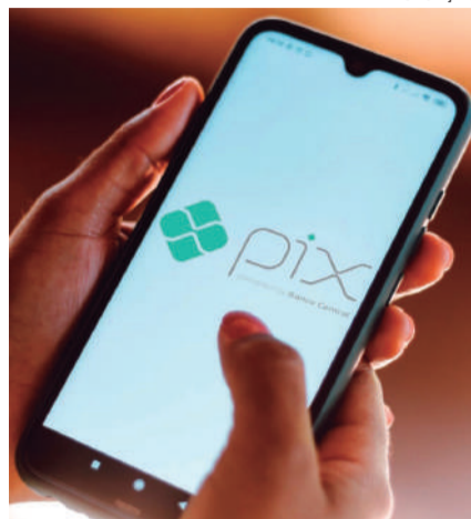
Pela facilidade, o PIX conta com mais de 143 milhões de usuários ativos, sendo a grande maioria pessoas físicas