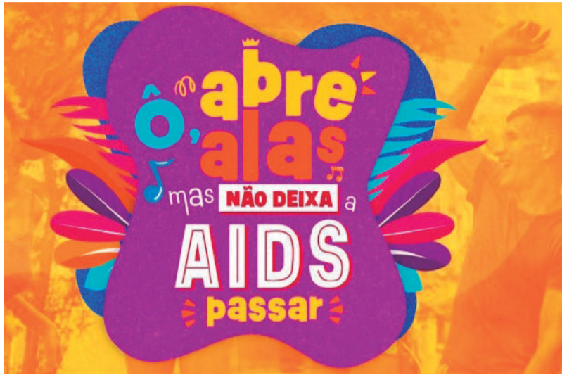
No RS, taxa de incidência de novos casos se caracteriza como uma epidemia generalizada onde o percentual de pessoas infectadas está acima de 1%

De acordo com a 14ª Coordenadoria Regional de Saúde, nos últimos 6 anos, foram registrados 344 novos casos de HIV nos 22 municípios de abrangência. Destes, 57,3% são homens e 42,7% mulheres. Maioria dos casos é de homens, entre 20 e 34 anos