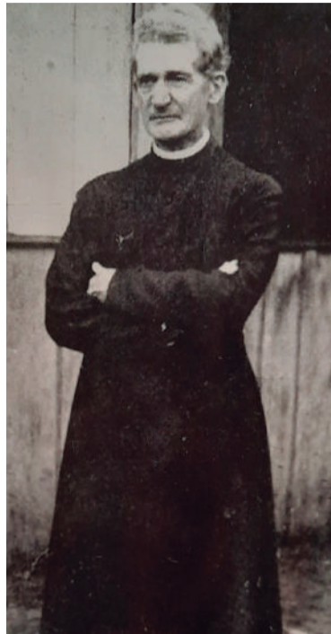
Monsenhor Testani foi um grande precursor no desenvolvimento de Três de Maio

Aqui, o vigário Vicente Testani iniciaria uma fase de grandes transformações na comunidade, que até hoje fazem parte de nosso dia a dia. Em 1929 foi fundada a Paróquia da Nossa Senhora da Conceição, abrangendo as áreas de Alegria, Chiapetta, Independência, São José do Inhacorá e Tucunduva. Também deu-se início às obras de um colégio católico (um bem ornamentado colégio de madeira, anterior ao atual prédio do colégio Dom Hermeto),