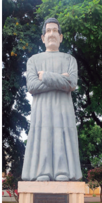
Estátua do Monsenhor Testani em frente à igreja matriz católica de Três de Maio

para ajudar a levar o ensino aos filhos dos fiéis que estudavam com dificuldades em salas improvisadas em casa de particulares.